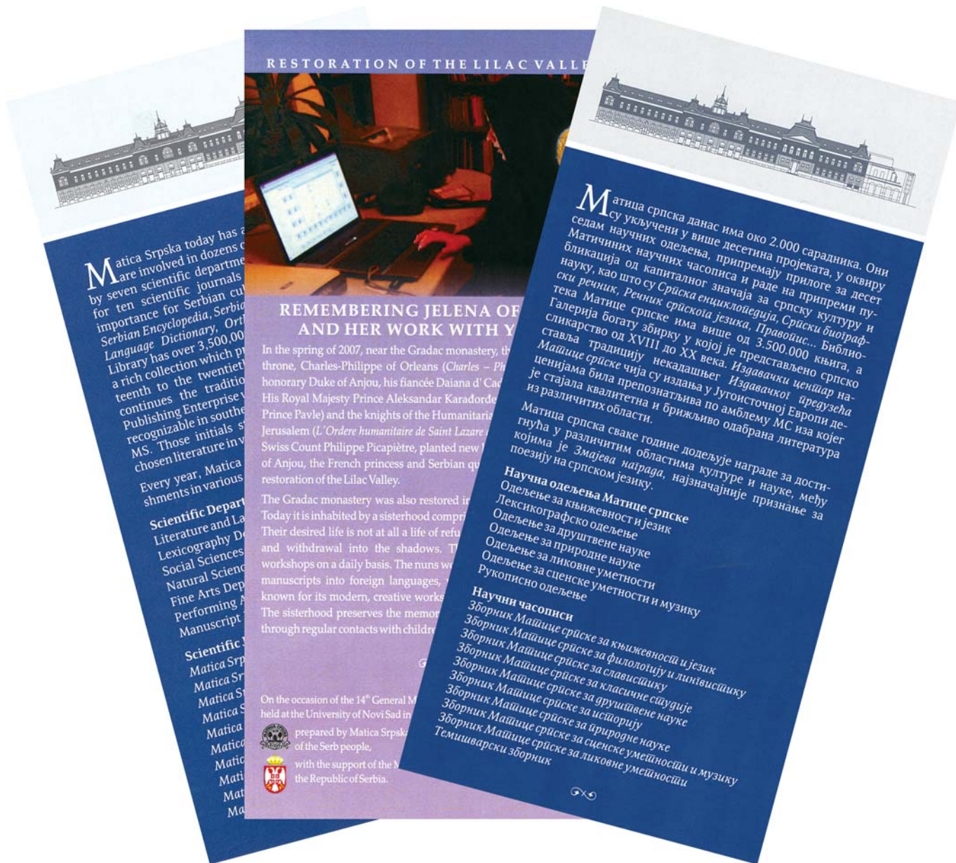
Нови промотивни леци на српском и енглеском језику