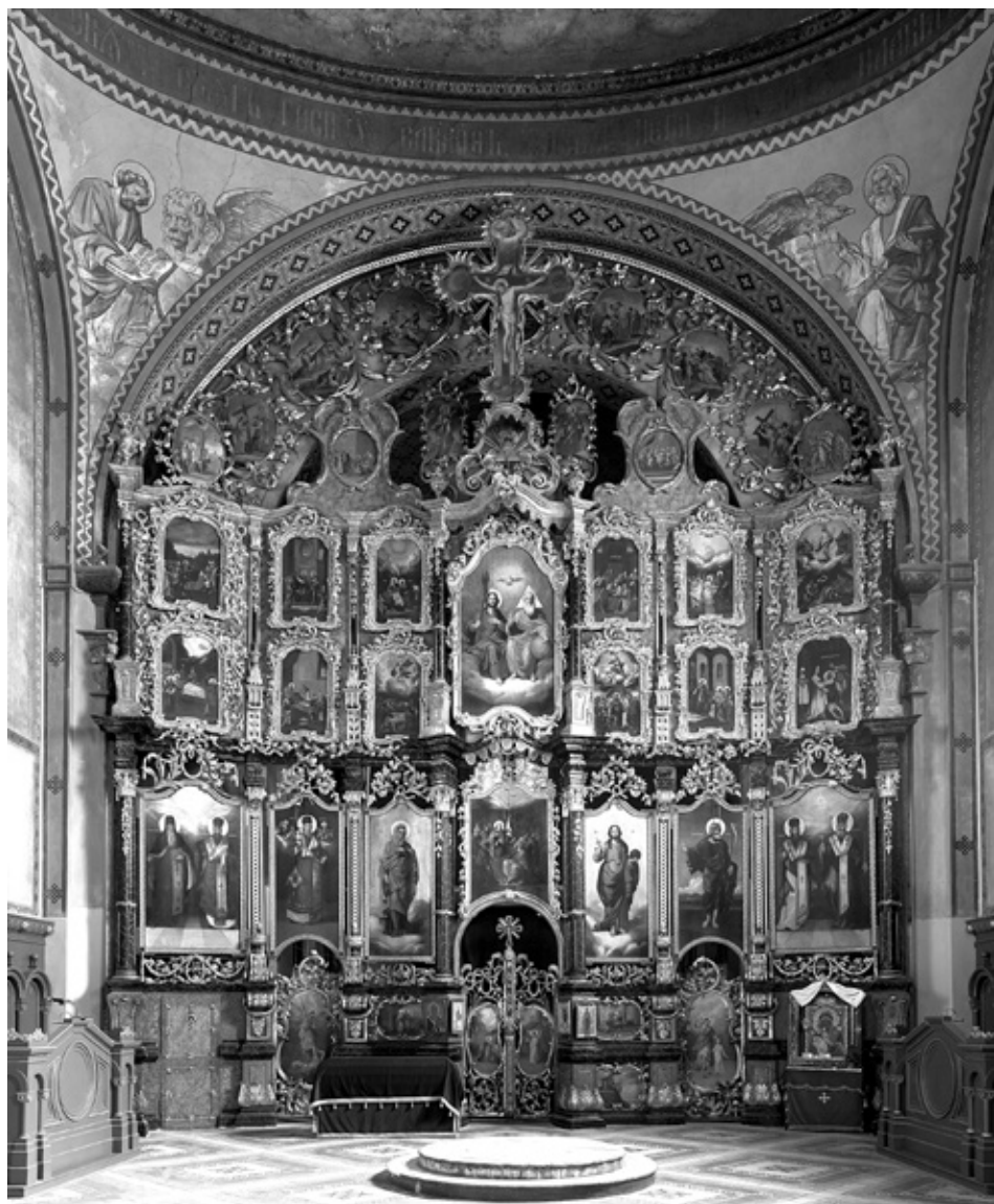
Теодор Крачун и Јаков Орфелин, Иконостас Саборне цркве у Сремским Карловцима, 1780.