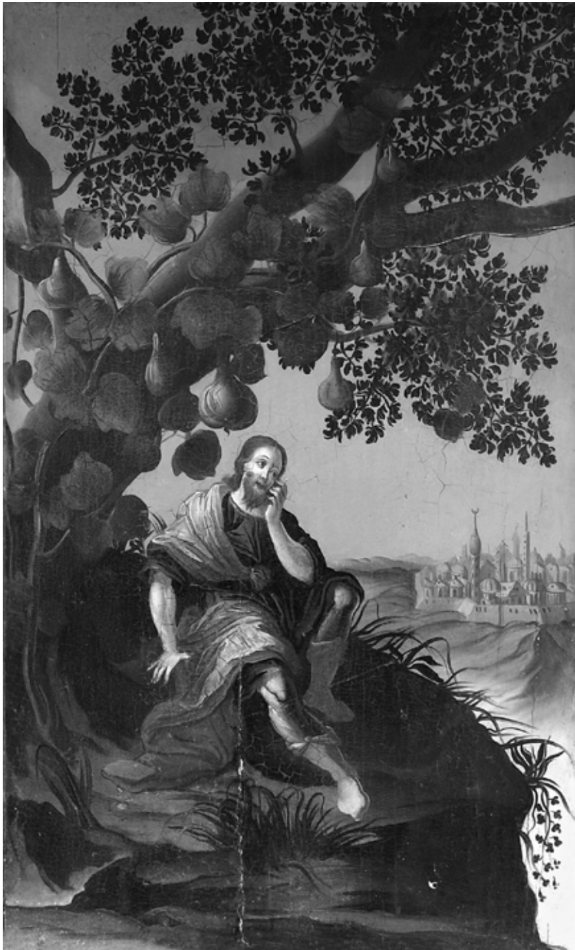
Василије Остојић, Јона пред Нинивом, 1759, манастир Крушедол