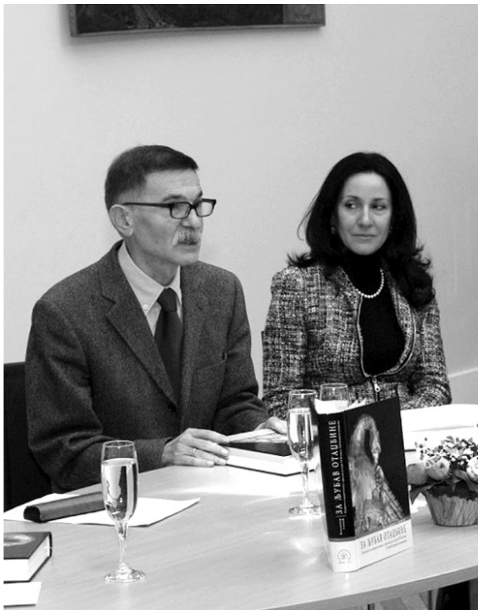
На промоцији књиге у Галерији Матице српске, 2018.