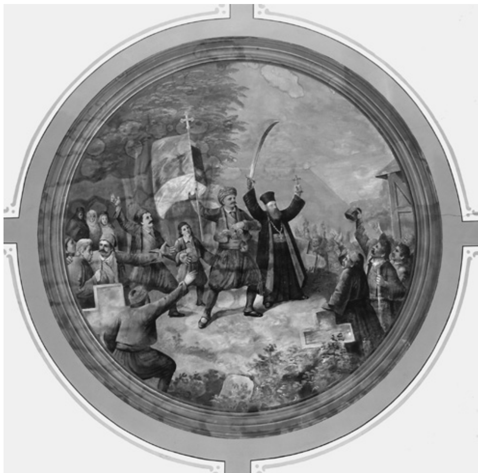
Таковски устанак, 1899, Окружно здање у Пожаревцу