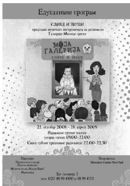
Плакат за дечји програм Слике и звуци

– СЛИКЕ И ЗВУЦИ (17. октобра 2008. – 15. априла 2009)