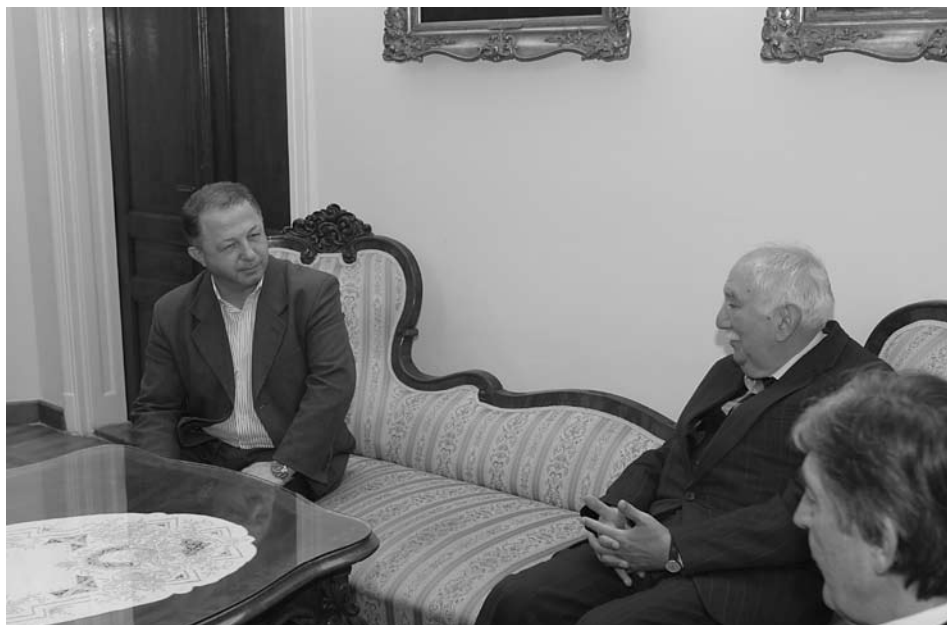
Посета министра Богољуба Шијаковића