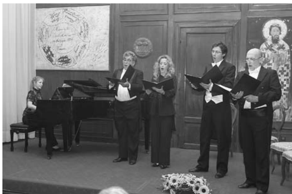
Музичко поетско вече – Прошлошћу одбранимо будућност Космета