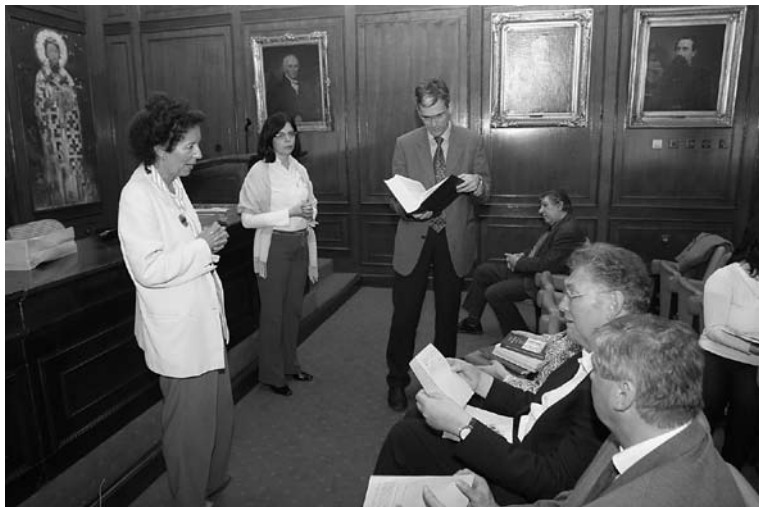
Посета делегације Универзитета у Јени