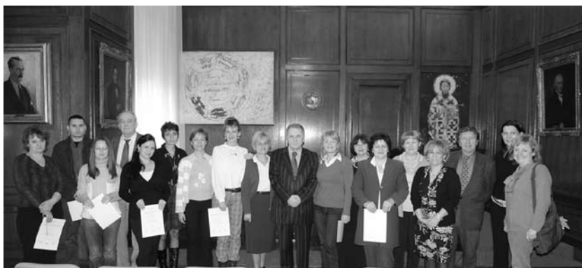
Са уручења уверења о положеном стручном испиту (3. XII 2008)

Полагању испита приступила су 34 кандидата у пролећном и 14 у јесењем року. Испит је почео полагањем предмета Алфаветски каталог и Стварни каталози (усмени испит и практична провера знања из именске, предметне и децималне обраде публикација). Полагање осталих предмета настављено је по распореду: Основи библиотекарства, Уставно уређење и прописи, Основи библиотечке информатике, Основи историје писма, књиге и библиотека и Основи библиографије.