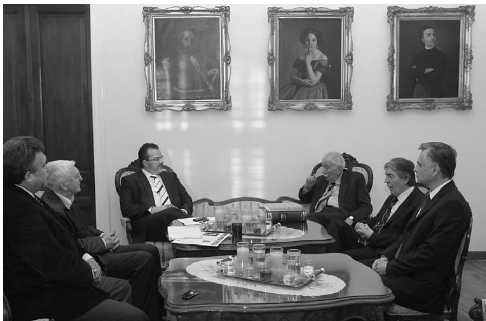
Посета министра Светозара Чиплића