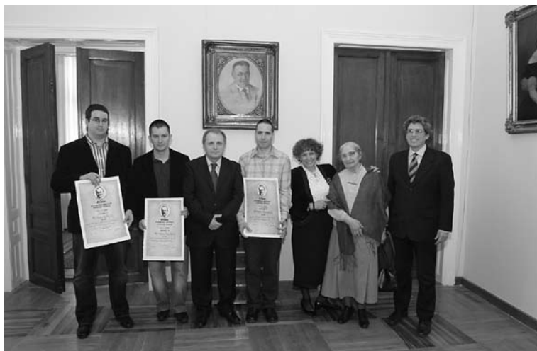
Добитници Пупинове награде

Награда је додељена на свечаности у Матици српској 21. марта 2008. године.