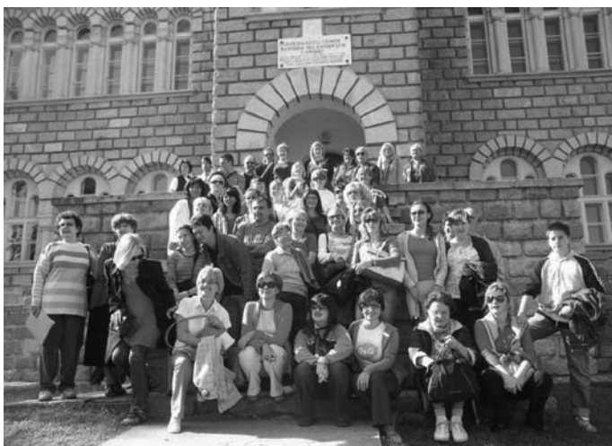
Радници БМС на излету у Орашцу (12. X 2008)

Јавне набавке су обављане сагласно Закону о јавним набавкама („Службени гласник РС”, бр. 39/02 и 55/04), Закону о буџету Републике Србије („Службени гласник РС”, бр. 58/07) и Правилнику о поступку доделе јавних набавки мале вредности БМС и спроведен је 31 поступак. Извештај о јавним набавкама достављен је Републичкој управи за јавне набавке.