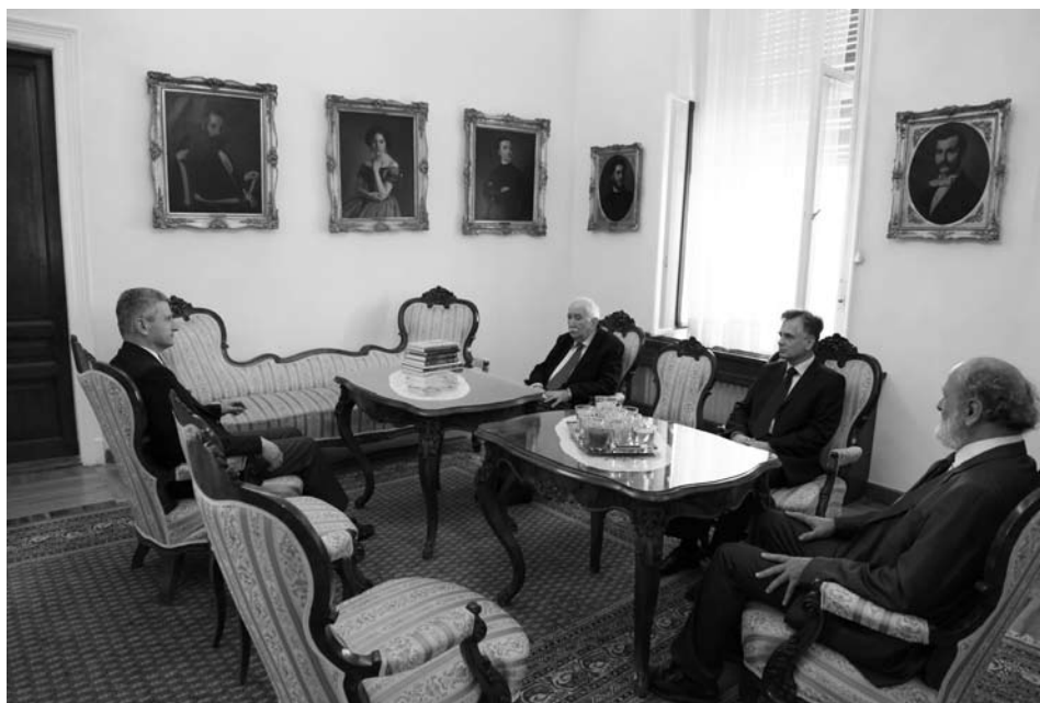
Посета министра Небојше Брадића