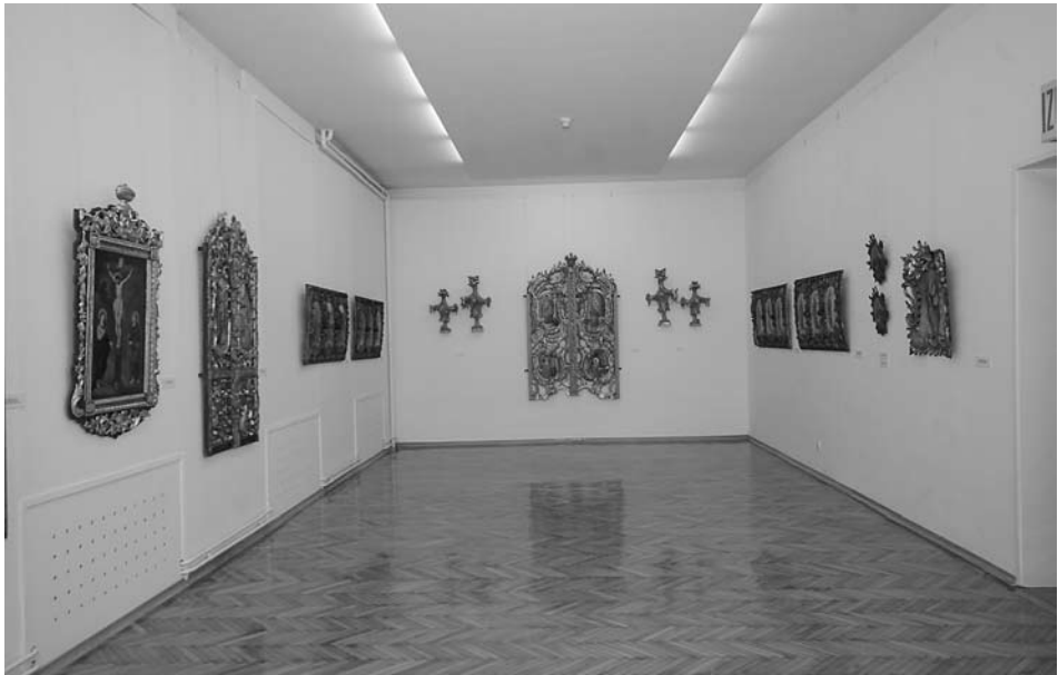
Изложба Дрворезбарска уметност – Билдхаорско художество