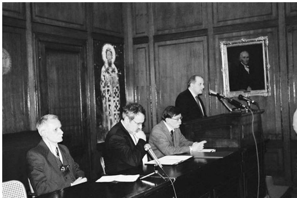
Свечана седница 16. II 2008.