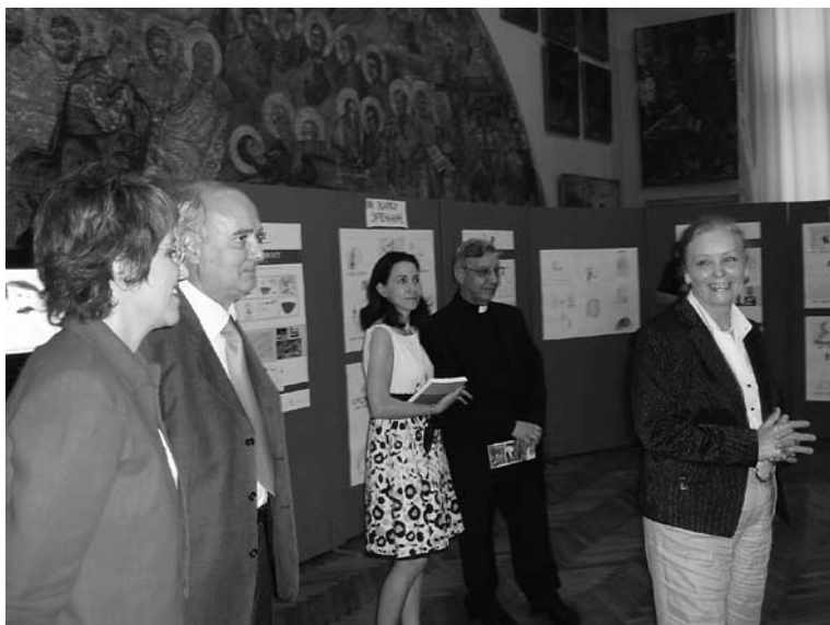
Отварање изложбе Осети уметност у ГМС

Галерија Матице српске у сарадњи са Музејом Дијацезе у Палерму реализовала је током 2008. године едукативни програм за деца Осети уметност. У програму Осети уметност учествовала су деца из Предшколске установе „Радосно детињство” из вртића „Чаролија” и „Весели вртић” и ученици основних школа „Јован Поповић” и „Жарко Зрењанин” из Новог Сада. Циљ едукативних радионица био је да се деца кроз обилазак сталне поставке упознају са делима ликовне уметности и развију своје креативне способности. Деца су пред одабраним делима разговарала са кустосима и педагозима са намером да кроз посматрање дела (чуло