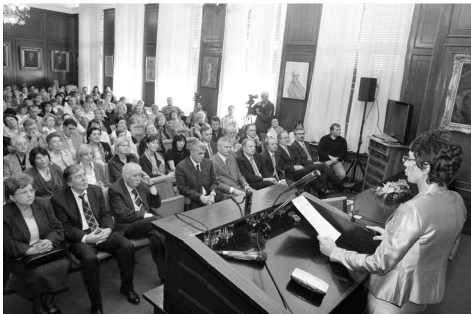
Скуп у Свечаној сали Матице српске поводом милион записа у електронском каталогу БМС (10. X 2008)