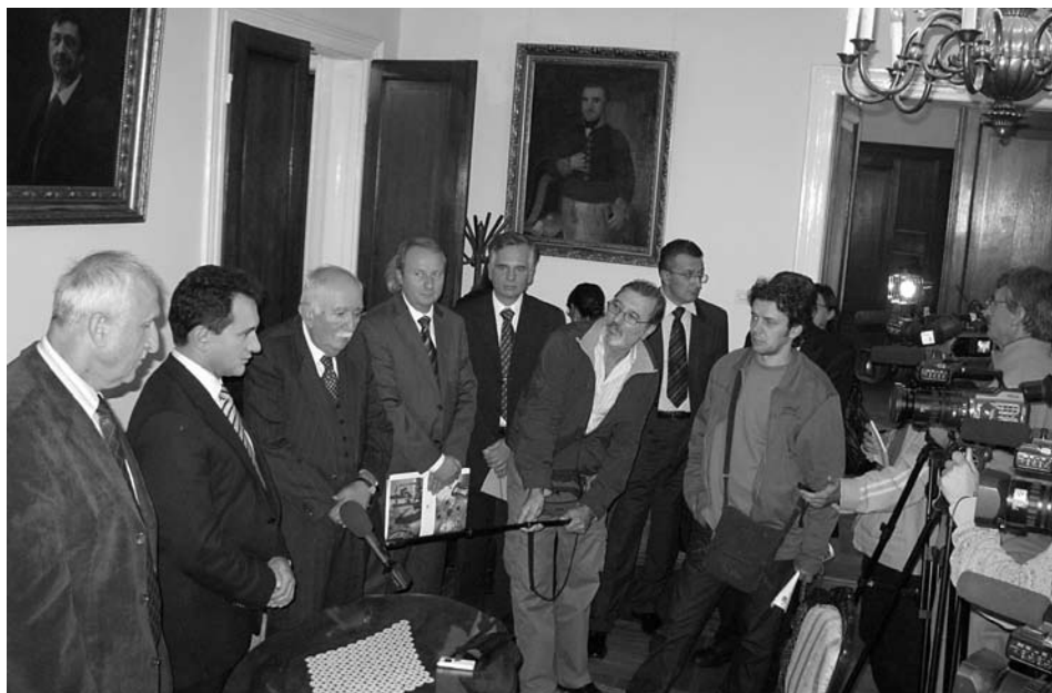
Посета министра Божидара Ђелића