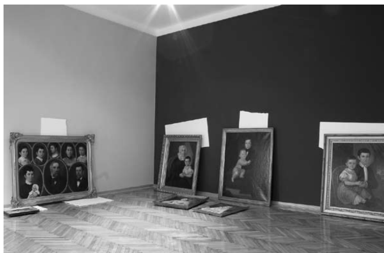
Припреме за отварање Сталне поставке 19. века

овим поводом била обезбеђена посебним алармним системом. Контрола стања одложених експоната поверена је Конзерваторском одељењу и експонати су редовно обилажени уз констатацију њиховог стања и неопходне интервенције. Након коначног одабира експоната који су планирани за излагање, преостала дела су одложена у депо. Изложено је 105 дела из збирке сликарства, 13 цртежа, 5 скулптура и 40 графика, укупно 163 експоната. У претходној поставци било је изложено 246 експоната – графика, слика и скулптура.