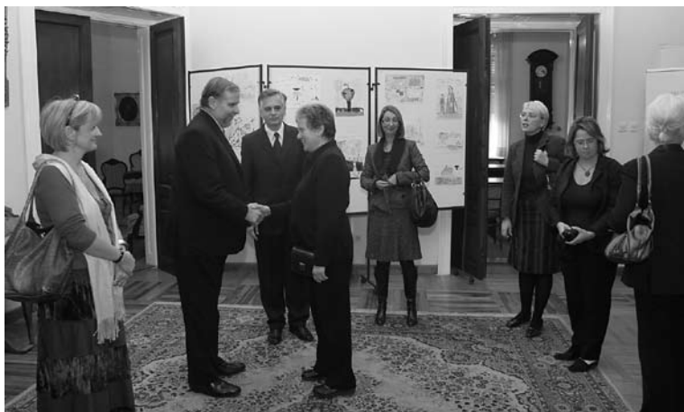
Посета професора права са европских и америчких универзитета