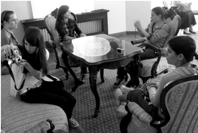
Гимназијалци из Секешфехервара у БМС (6. VI 2008)

За допринос сређивању фондова Хиландарске библиотеке БМС је добила захвалницу од манастира Хиландар.