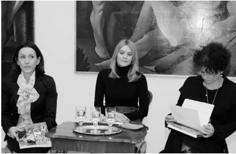
Промоција књиге Теме и идеје модерног: Српско сликарство 1900–1941 .