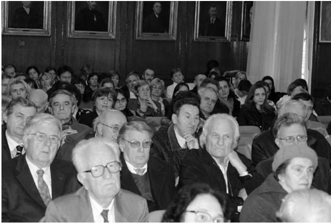
Представљање књиге Историја српске књижевне критике (1768–2007) академика Предрага Палавестре (15. XII 2008)