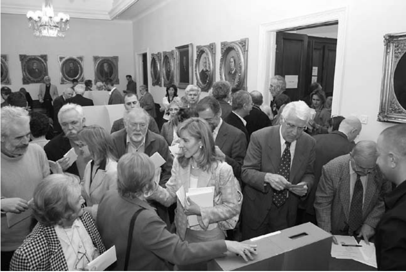
Изборна скупштина Матице српске