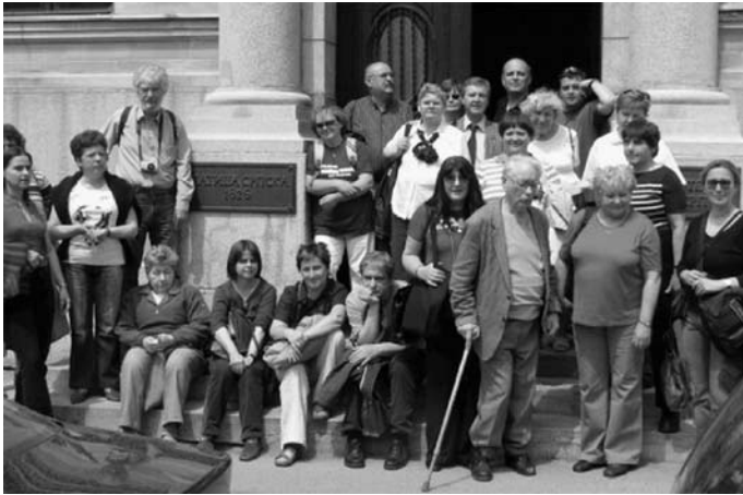
Библиотекари из Будимпеште у посети БМС (23. V 2008)