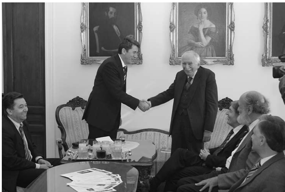
Посета министра Жарка Обрадовића