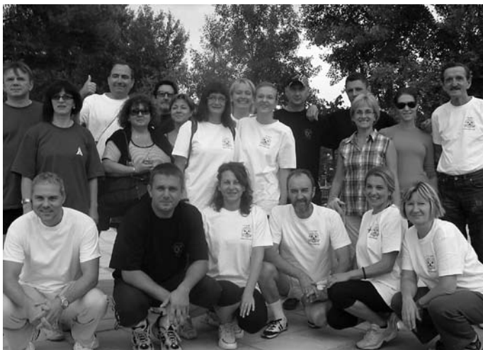
Радници БМС на спортским играма у Грчкој (септембар 2008)