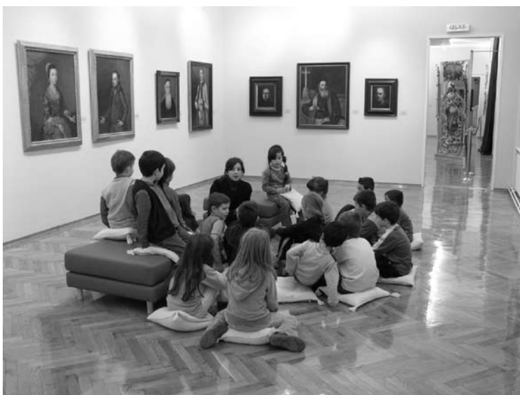
Ноћ музеја – Лепотице и јунаци

Током школске 2007/08. године Галерија је у сарадњи са Предшколском установом „Радосно детињство” реализовала едукативни програм Лепотице и јунаци. У периоду од 17. октобра 2007. до 15. априла 2008. године у програму је учествовало 3000 малишана. У поводу друге новосадске Ноћи музеја Галерија је приреди-