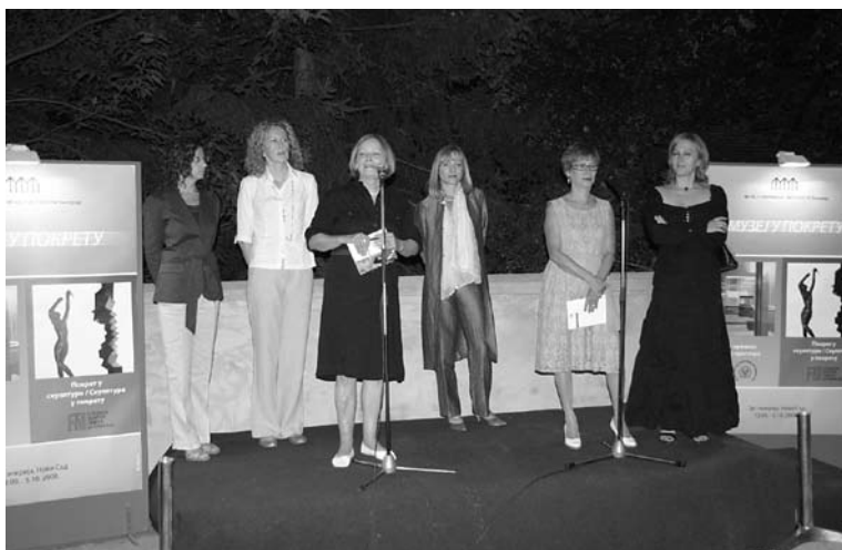
Отварање изложбе Град – хронике урбаних простора