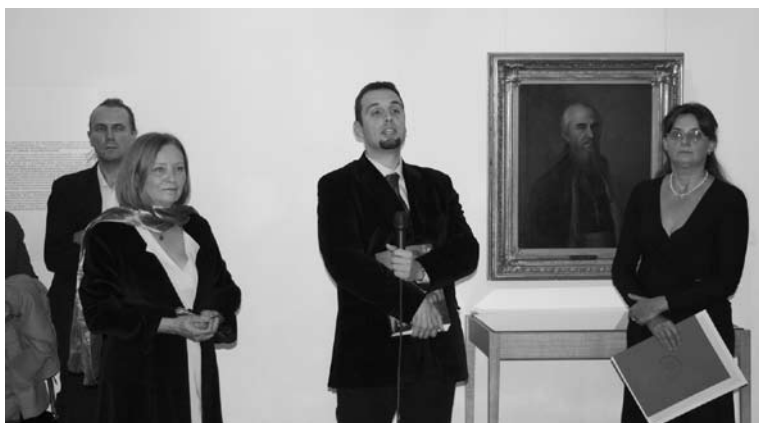
Отварање изложбе Јаков Орфелин и његово доба