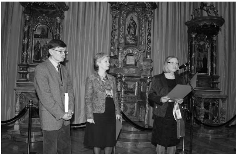
Отварање изложбе Дрворезбарска уметност – Билдхаорско художество