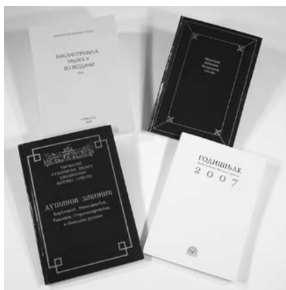
Издања БМС у 2008. години

Раскрића : књижевно-филозофски годишњак Сретена Марића , бр. 6 (са СО Косјерић и ЈП „Службеним гласником” у Београду).