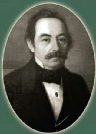
Јован Хаџић (Сомбор, 19. IX 1799 – Нови Сад, 4. V 1869)

Потиче из сомборске трговачке породице. Након очеве смрти, 1812. године, преселио се у Нови Сад где се о његовом школовању старао ујак Гедеон Петровић, утицајни владика бачки. Српску основну школу учио је у Сомбору, а немачку у Оџацима. Шест разреда гимназије завршио је са одличним успехом у Сремским Карловцима а три разреда филозофије у Пешти. Право је студирао у Пешти и Бечу. Током студија интересовао се и за естетику, филозофију, историју и природне науке. Године 1826. на Универзитету у Пешти одбранио је докторску дисертацију О узроцима развода брака, према учењу Источне православне цркве Христове . Исте године је постао адвокат. Адвокатуром се бавио од 1827. до 1837. а 1834. је изабран за сенатора Магистрата слободног краљевског града Новог Сада.