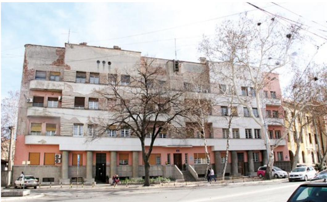
Сл. 4. Зграда за службенике Моравске бановине

Зграда која је служила као резиденција службеника Моравске бановине смештена је на углу улица Стефана Првовенчаног и Тирила и Методија. Изграђена је 1938. године (КАДИЈЕВИЋ 1998: 141; КЕКОВИЋ, ЧЕМЕРИКИЋ 2006: 170–171; КЕКОВИЋ 2009: 35; КАДИЈЕВИЋ 2018: 315; Миловановић 2020: 10; 2021: 33, 55). Троспратна грађевина, пројектована у модернистичком стилу, одликује се фасадном декорацијом са пругама које су добијене увлачењем волумена, што је карактеристично за модерну архитектуру. Улазну партију чине три улаза, при чему је средњи