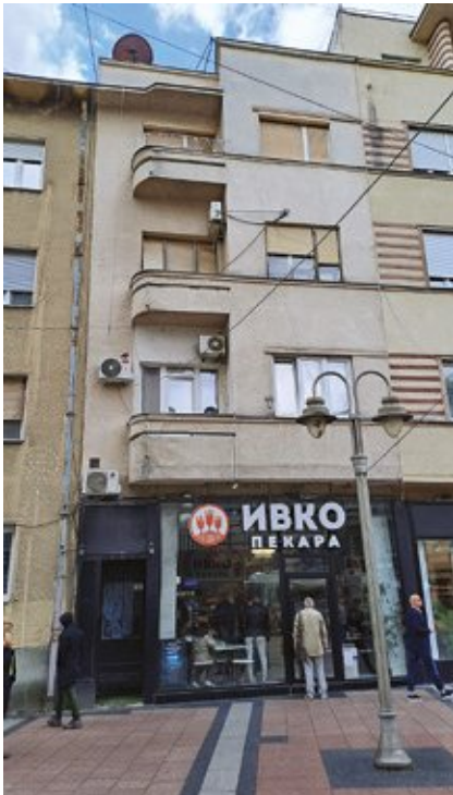
Сл. 6. Зграда трговца Светозара Милојковића у Нишу

сведочанство о њеном пројектанту. 19 Последњи радови на згради Народног позоришта извршени су 2023. године доградњом мале сцене, према пројекту бироа „Форма Антика” архитекте Симе Гушића. 20