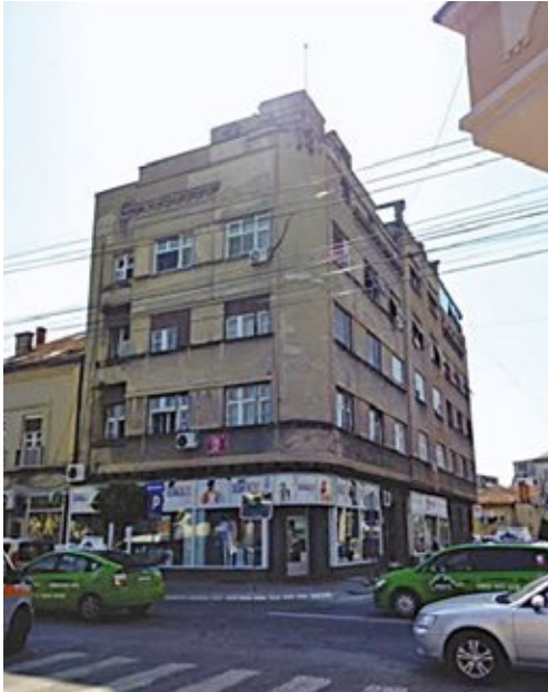
Сл. 3. Зграда Ђоке Јовановића Турчије у Нишу

различити локали, док је преостали део зграде намењен становању (Миловановић 2020: 10; 2021: 33, 64–65).