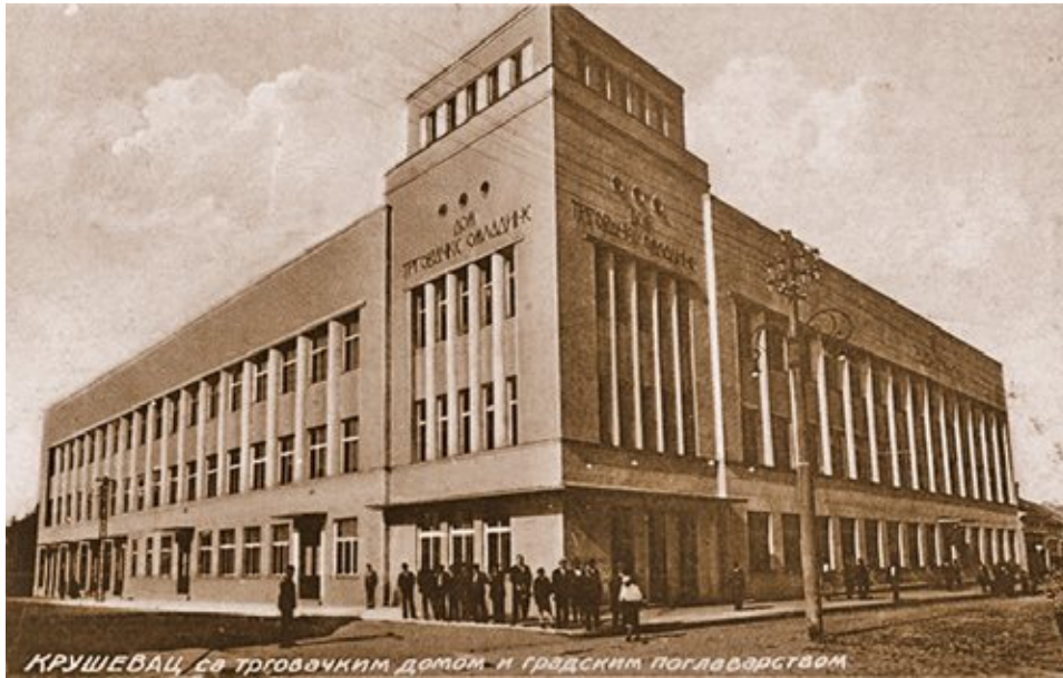
Сл. 7. Зграда Трговачког дома у Крушевцу