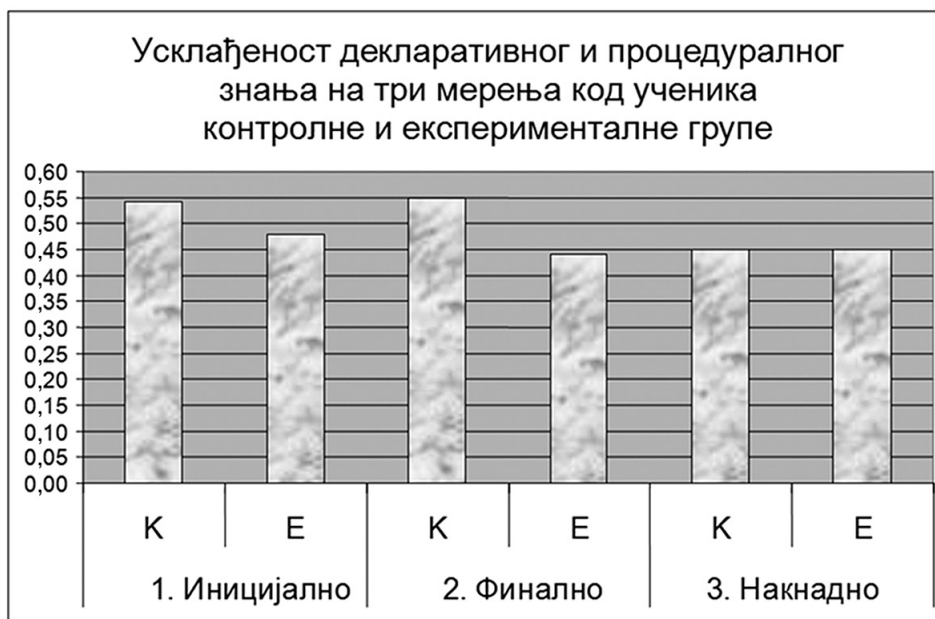
Дијаграм 1: Разлике у усклађености декларативног и процедуралног знања ученика контролне и експерименталне групе (мање вредности означавају усклађенија знања)

Из табеле 1 може се видети да је разлика у усклађености декларативног и процедуралног знања, између групе ученика који су учили на традиционалан начин и групе ученика који су учествовали у примени кооперативне наставе природе и друштва, на финалном мерењу била статистички значајна ( p=0,010 ). На иницијалном и накнадном мерењу нису регистроване статистичке значајности ( p=0,180 иницијално и p=0,894 накнадно).