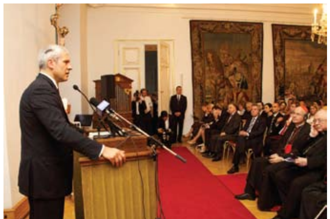
Обраћање господина Бориса Тадића, председника Србије