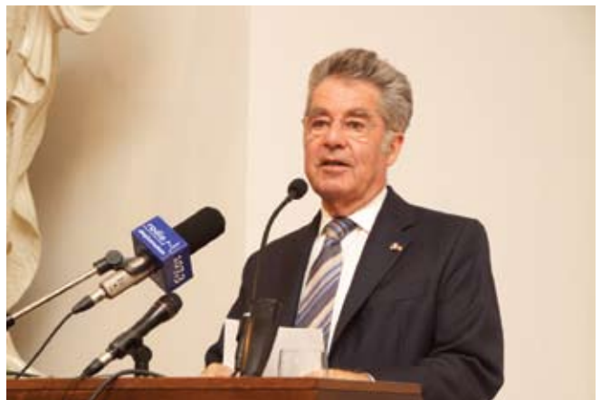
Обраћање господина Хајнца Фишера, председника Аустрије