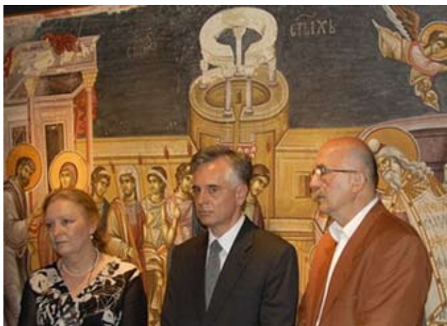
Конференција за медије у Бечу