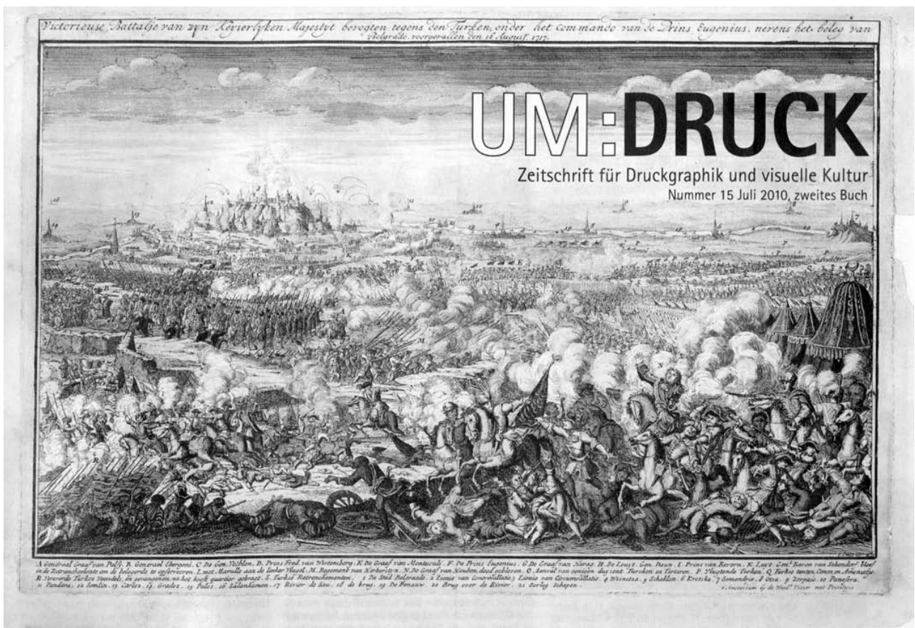
Jan SMIT: Schlacht um Belgrad zwischen Österreichern und Türken, 16. August 1717. Amsterdam, um 1721, Farbkupferstich vergoldet, 30 x 45 cm; Stadtmuseum Belgrad, Inv.Nr. MGB I 1 467

In Zusammenarbeit mit der Matica Srpska, der ältesten serbischen Kultur- und Wissenschaftsinstitution und der ökumenischen Stiftung Pro Oriente zeigt das Dom Museum anlässlich der 150-Jahrfeier der Gründung der Serbisch-Orthodoxen Kirchengemeinde zum Hl. Sava in Wien Einblicke in das reiche Kulturerbe Serbiens der letzten zwölf Jahrhunderte.