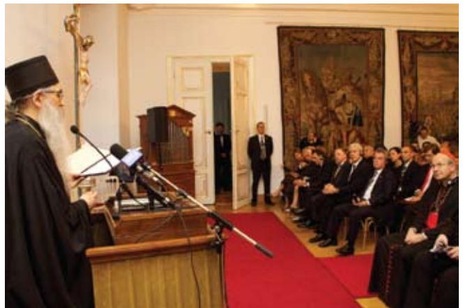
Обраћање Његовој преосвећености Иринеја Буловића, епископа бачког