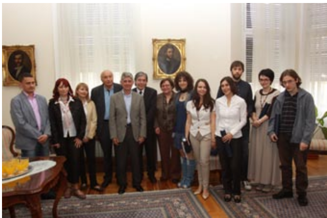
Бранкова наџрада за 2011. љодину