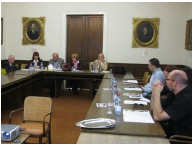
Окруџили сџио о вишеџомном речнику срџскоџ језика