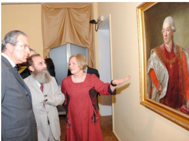
Изложба „Страни портрети XVIII и XIX века у колекџији Галерије Матице српске“