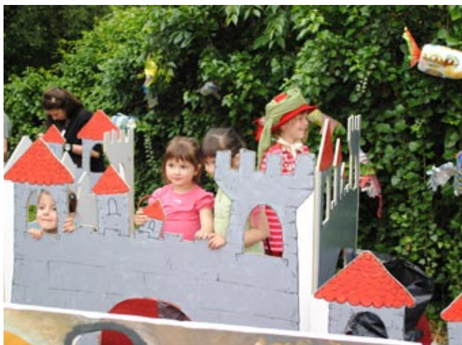
Галерија Матице српске у Ноџи музеја