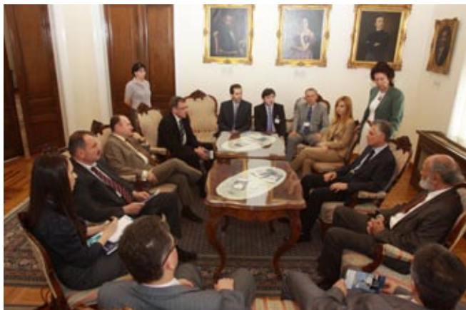
Посџта љредсџавника Елекџиродисџрибуџија Франџуске, Мађарске и Војводине