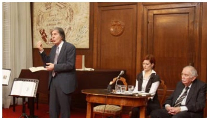
Свечани скуп њосвећен Иви Андрићу