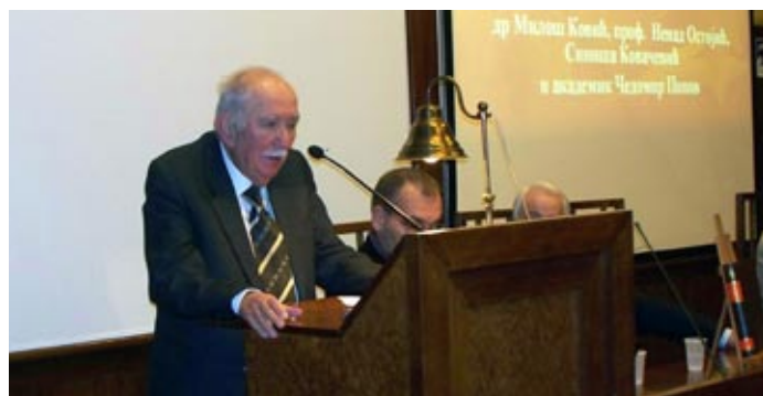
Представљање Српској биографској речнику у Коларчевој заједници