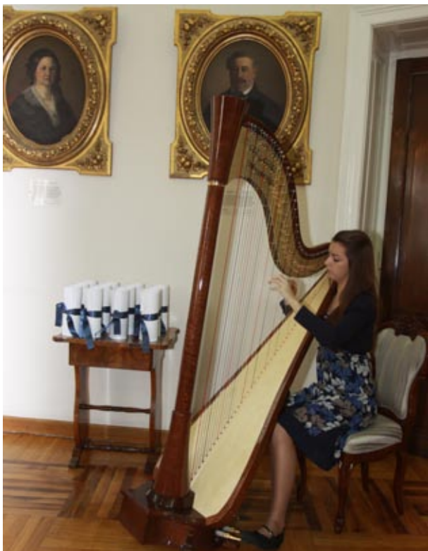
Дан добродјелора Матице српске