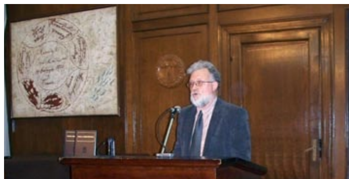
Представљање Српске енциклопедије у Матици српској