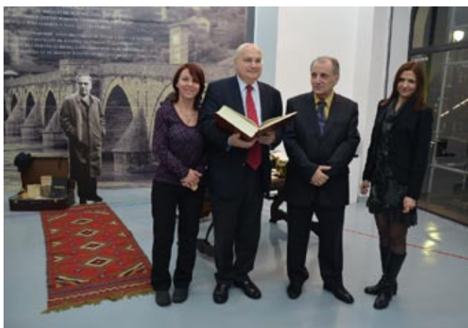
Представљање Библиографије Иве Андрића у Паризу