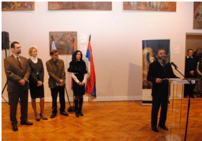
Изложба За љубав отаџбине