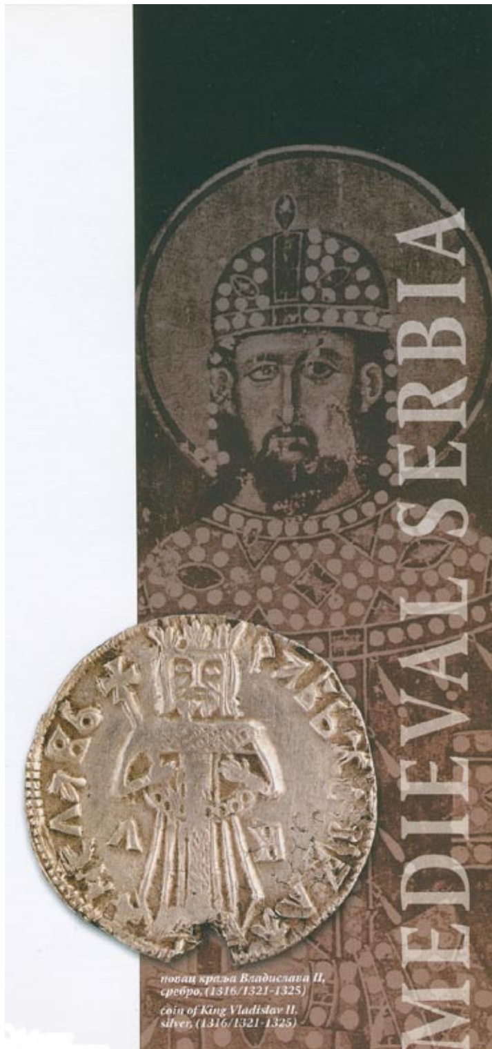
новац краља Владислава II, сребро, (1316/1321-1325) coin of King Vladislav II, silver, (1316/1321-1325)