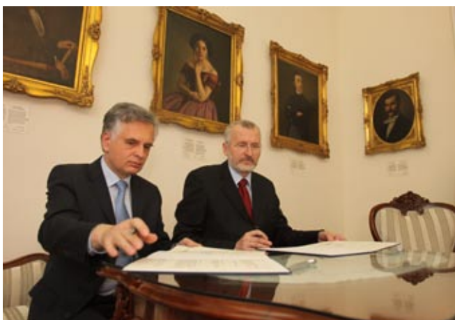
Пројекат о сарадњи са Новосадским сајмом