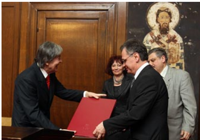
Свечана седница Матице српске