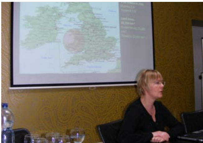
Међународни научни скупи о мајицама у Будимпешти